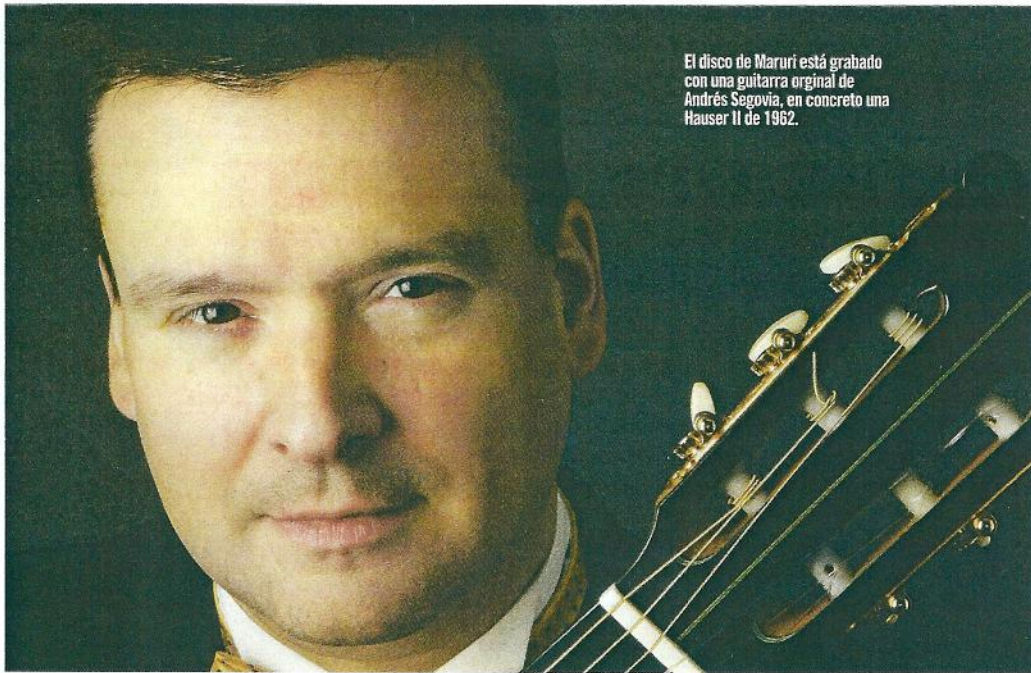
El disco de Maruri está grabado con una guitarra original de Andrés Segovia, en concreto una Hauser II de 1962.